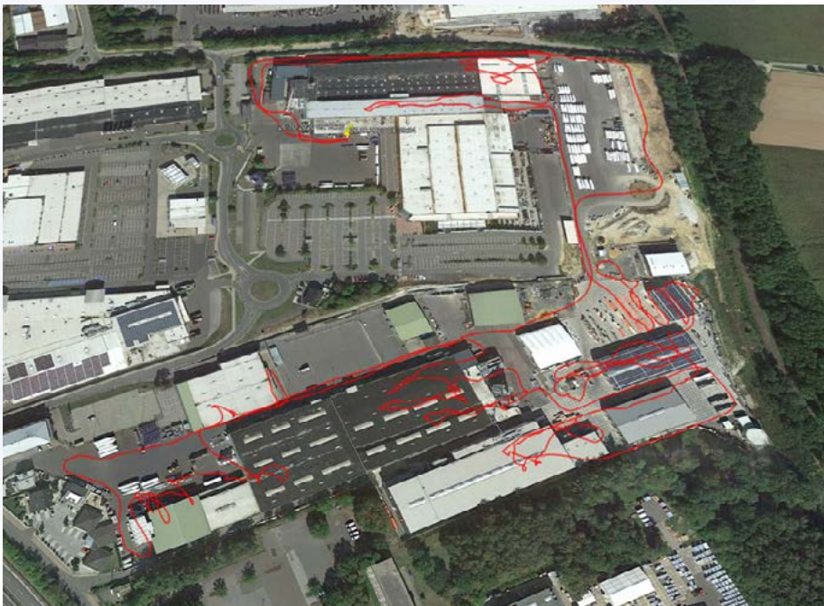
Beispiel Outdoor Locator

Mit unserem Mobilfunk-GPS-Modul haben Sie die Möglichkeit zur Ortung von Maschinen im Außenbereich. Dabei erfassen wir regelmäßig die Positionsdaten und speichern diese auf Wunsch im Logbuch ab. Mit einem einfachen Klick auf die Positionsdaten können Sie sich die genaue Position z.B. bei Google Earth anzeigen lassen.